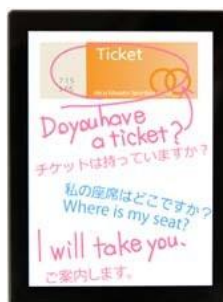
Сотрудник с нарушением слуха помогает иностранному посетителю найти свое место в зале, где проводится мероприятие