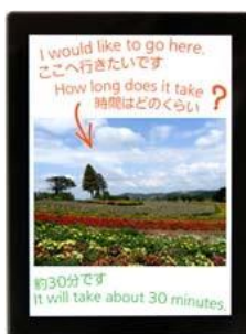
Турист спрашивает у водителя такси, сколько времени займет путь до указанного пункта назначения