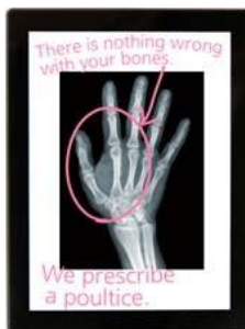
Врач дает пояснения по рентгеновскому снимку пациенту с нарушением слуха